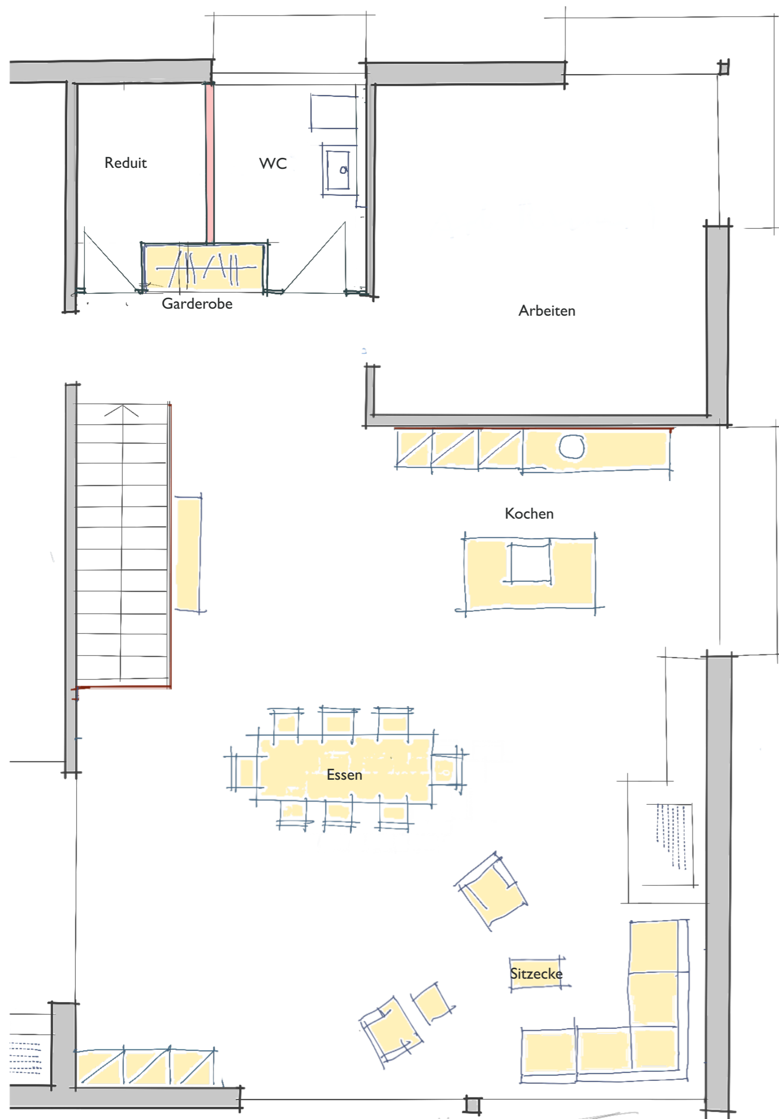
Kochinsel im Zugangsbereich Essbereich gegen den Sitzplatz