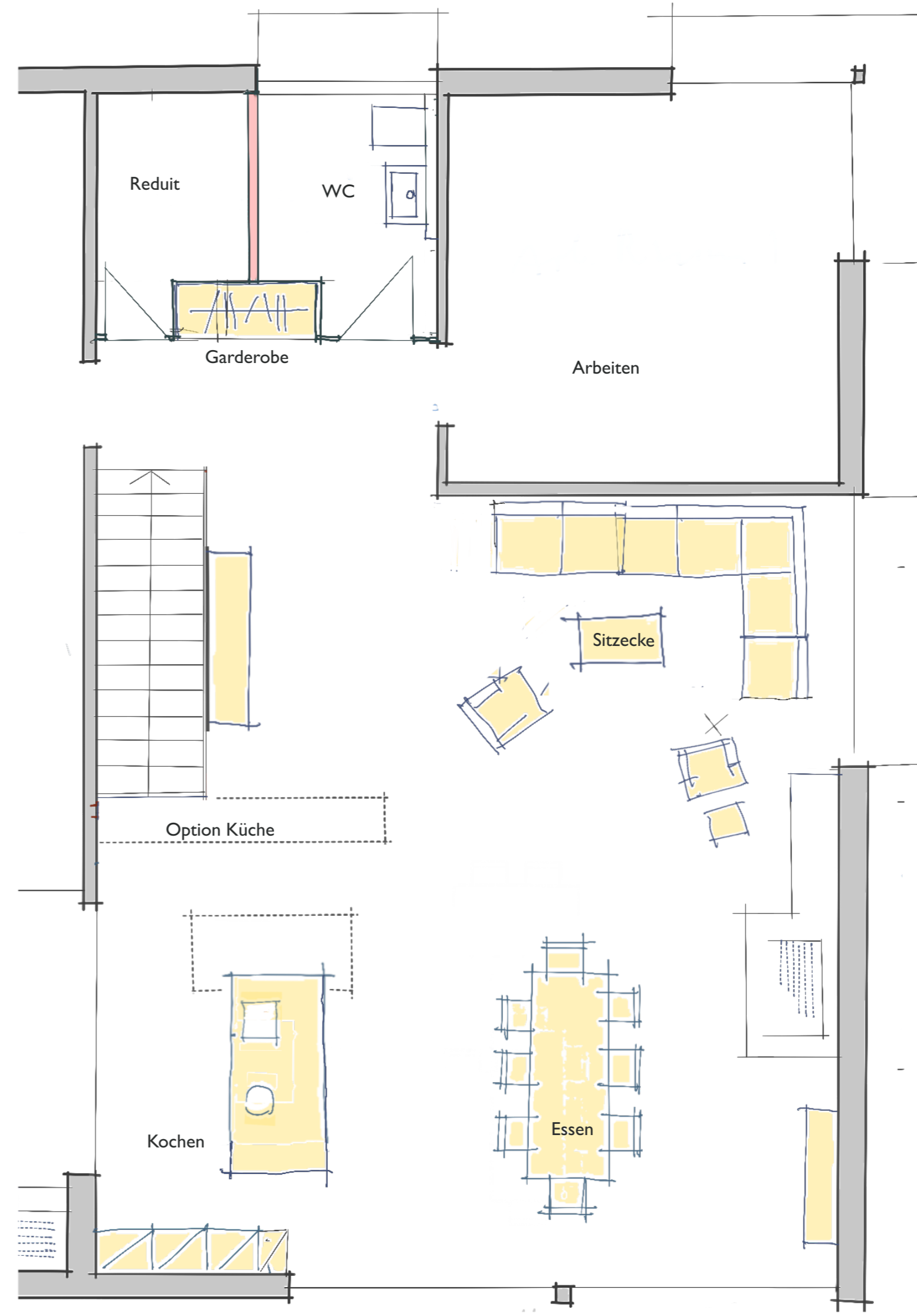
Kochinsel gegen den Aussensitzplatz Sitzecke im Eingangsbereich