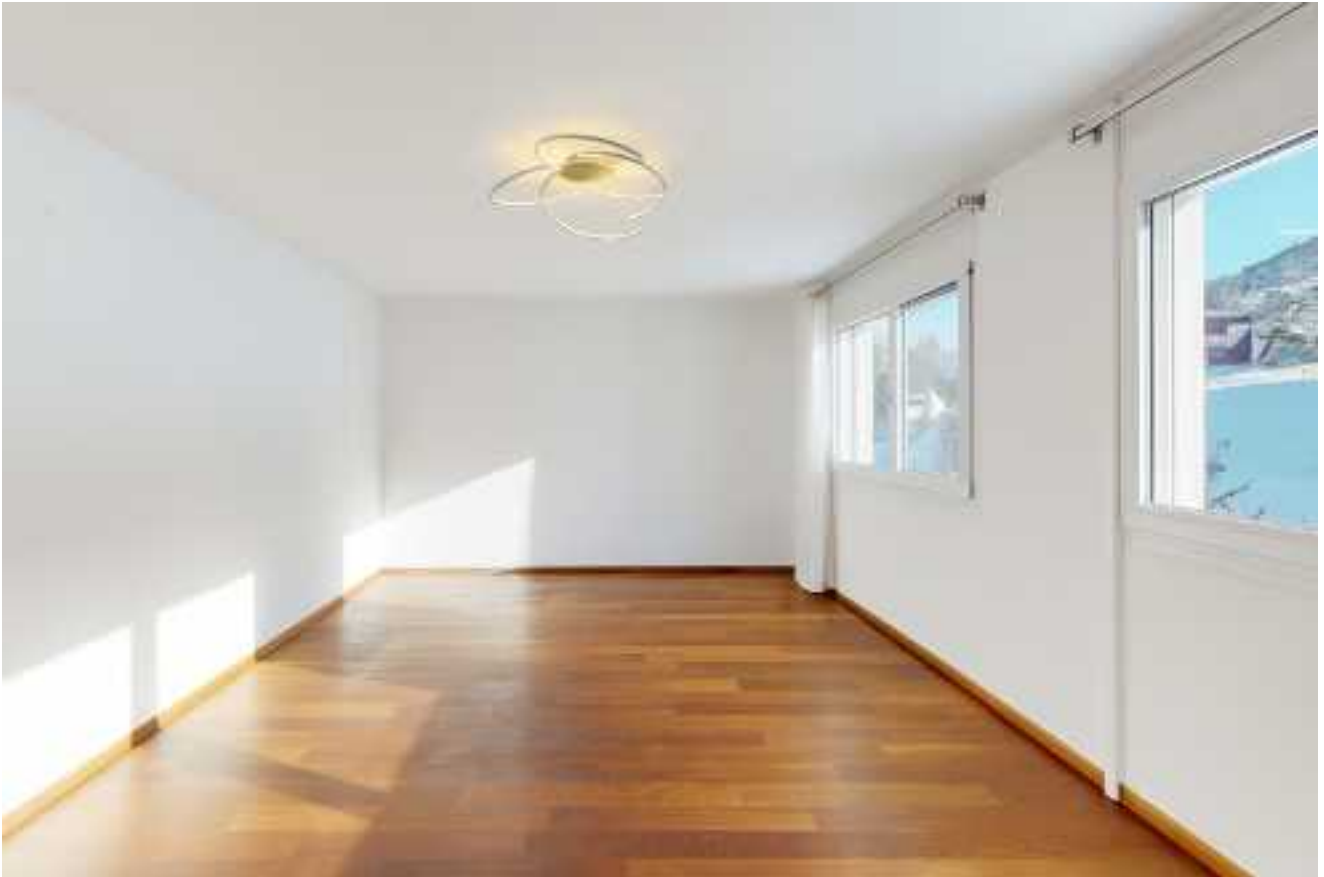
Das zweite Zimmer öffnet sich nach südöstlicher Richtung...