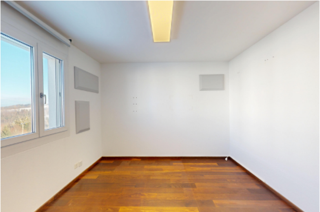
Dank seiner idealen Grösse eignet sich ein drittes Zimmer perfekt als Fitnessraum, Kinderzimmer....