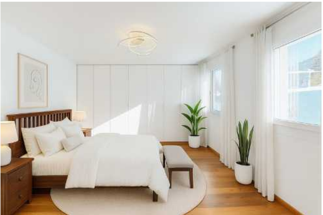
... und wird besonders am Morgen von freundlicher Helligkeit erfüllt (digital möbliert)