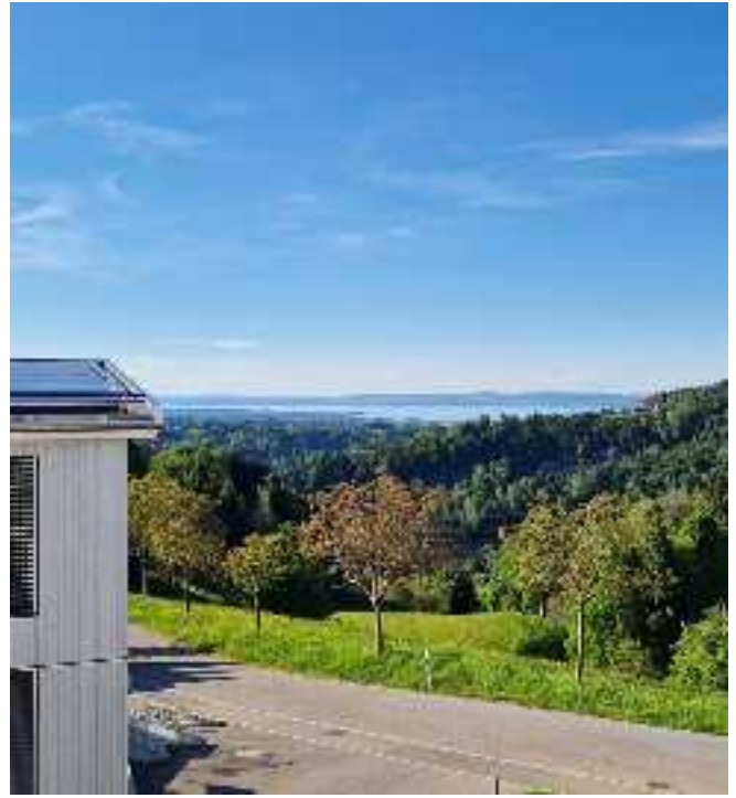
Hier geniessen Sie eine Fernsicht bis hin zum Bodensee