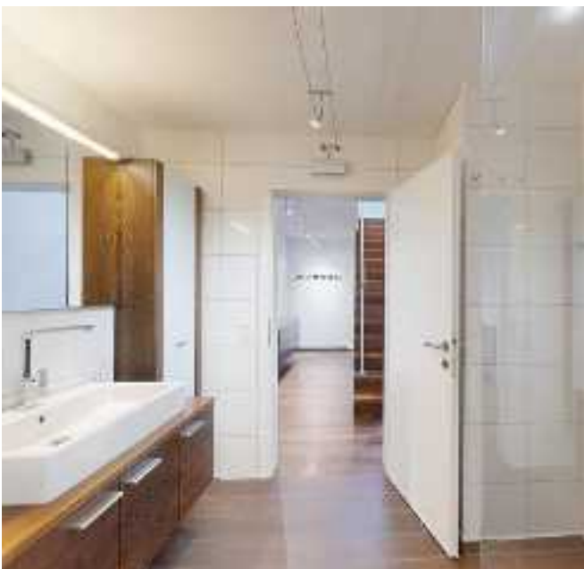
Das elegante Bad bietet edle Details, einen integrierten...