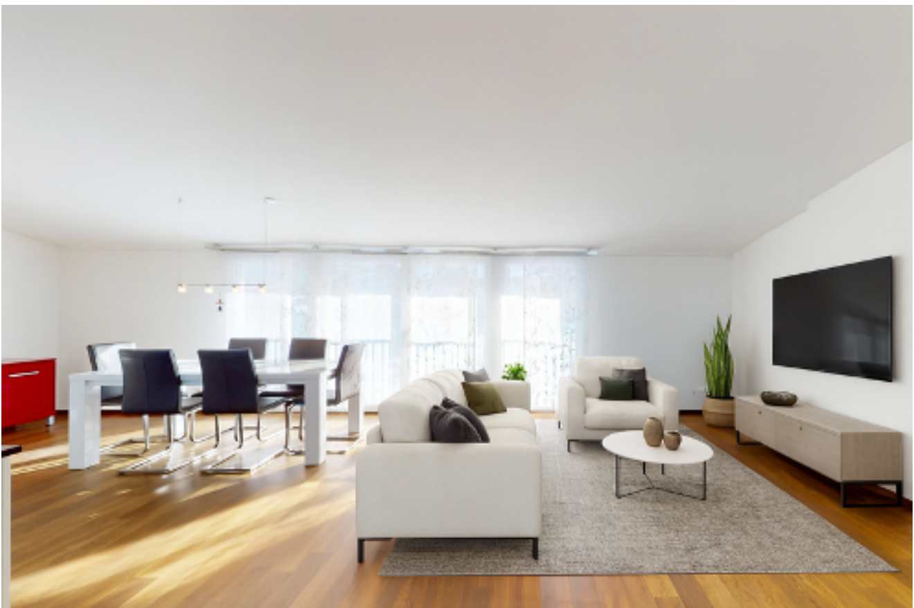
So könnte Ihr persönlicher Wohnraum aussehen (digital möbliert)