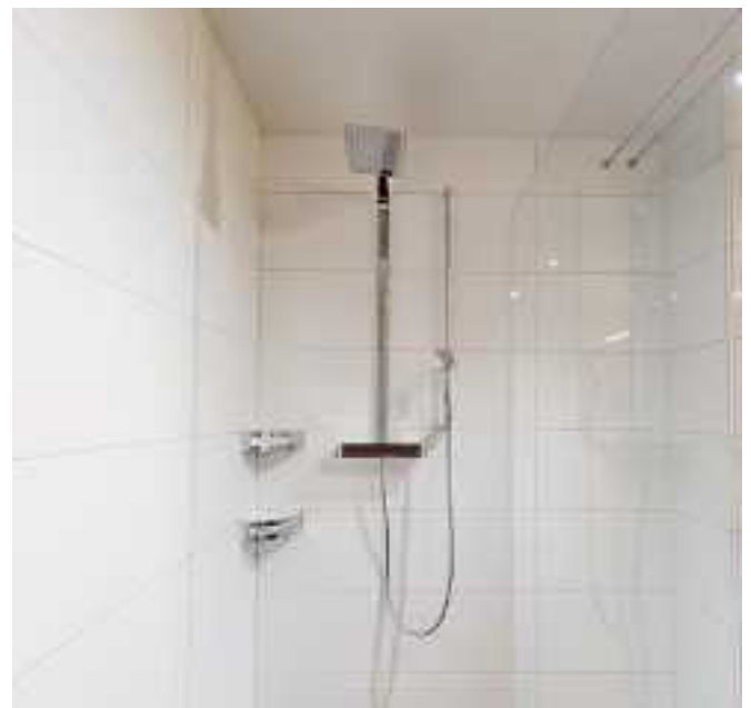
... V-Zug Waschturm und eine begehbare Regendusche