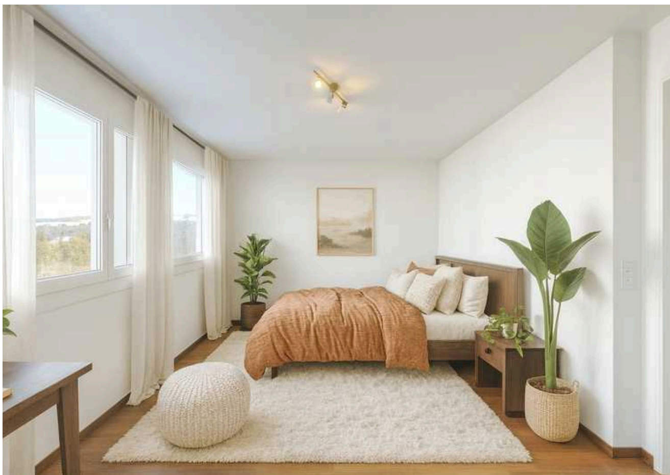
Dieses Zimmer liegt in nordwestlicher Ausrichtung und geniesst eine exklusive Seesicht (digital möbliert)