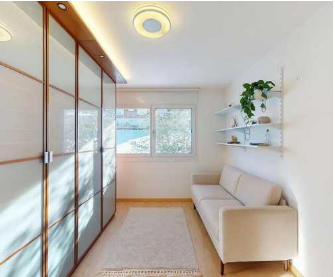
Ein weiteres Zimmer überzeugt mit einem optimalen Einbauschränk, welcher zum Verkaufsumfang gehört (digital möbliert)