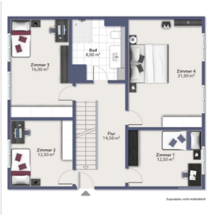
Das Untergeschoss mit vier Schlafzimmern und einem Badezimmer