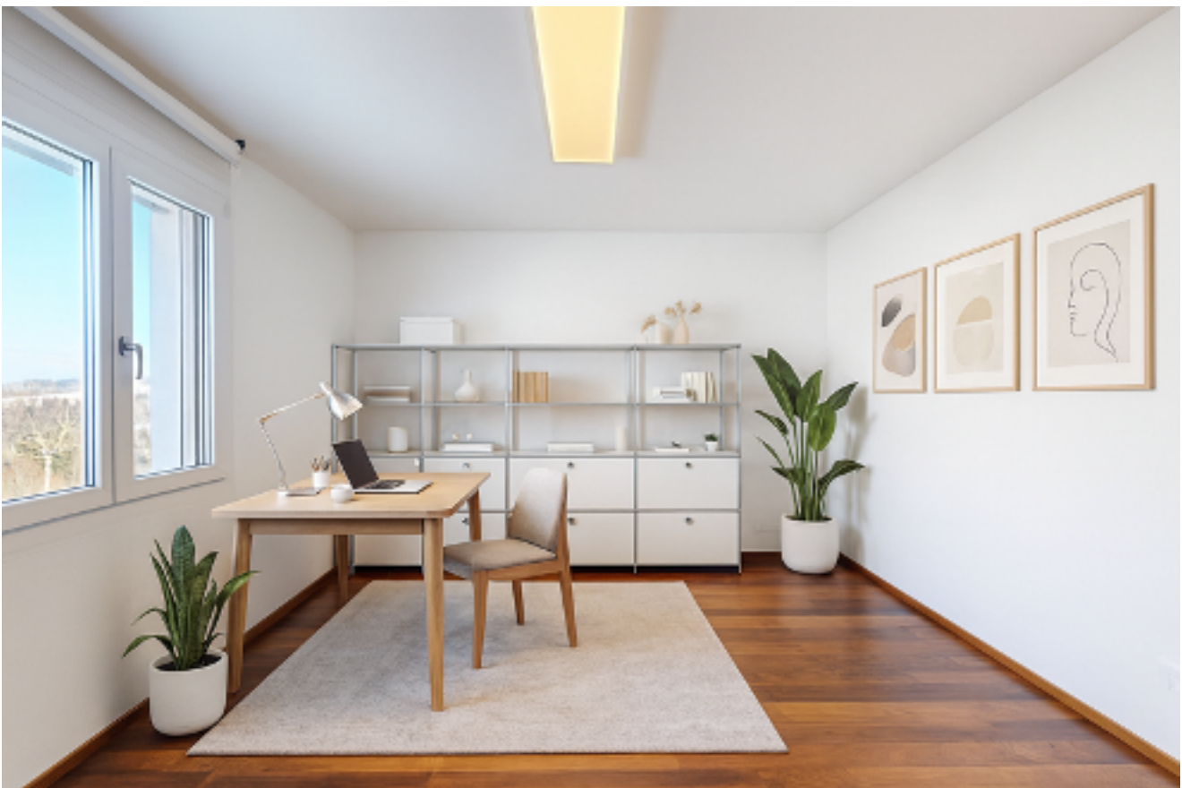
... Homeoffice oder flexibler Rückzugsort (digital möbliert)