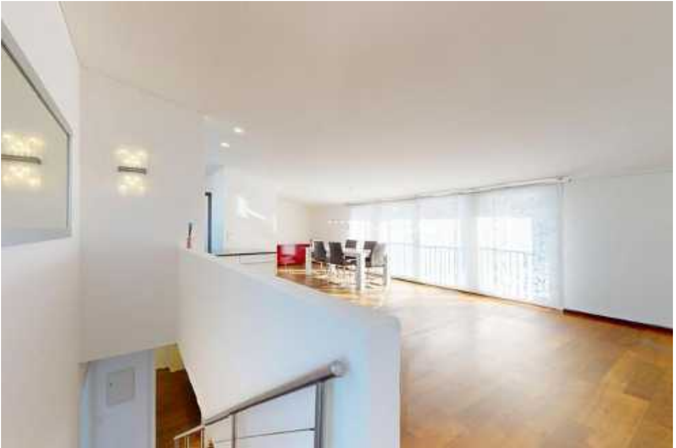
Eine offene Raumstruktur verleiht dem Wohnbereich eine einladende und moderne Atmosphäre