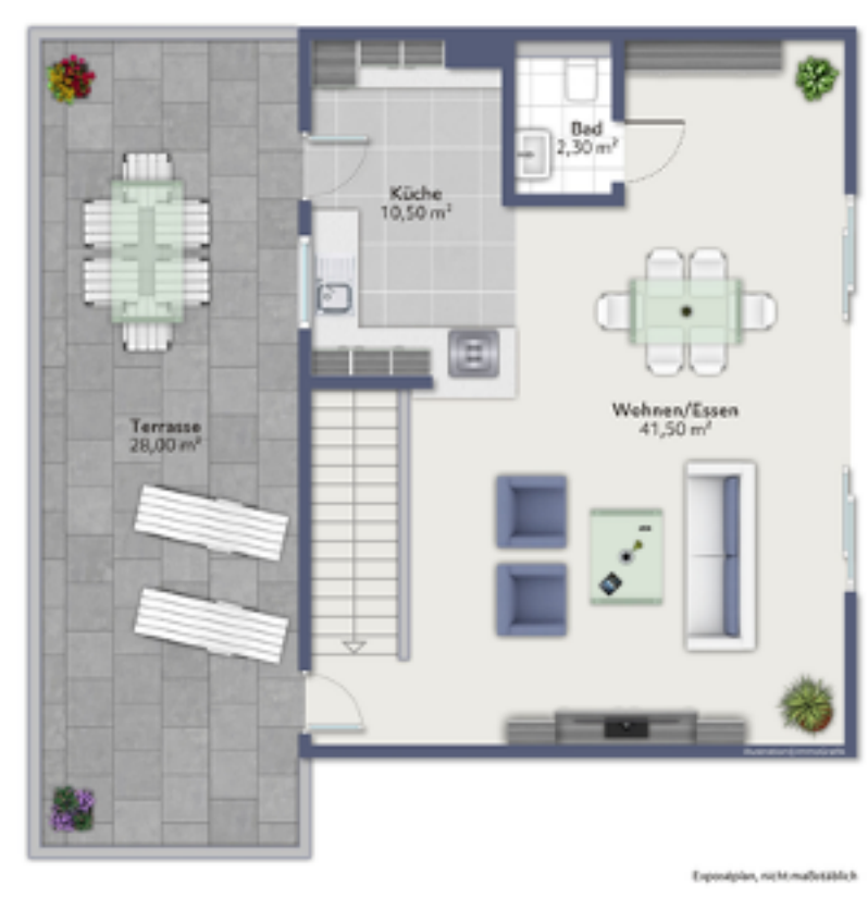
Das Obergeschoss mit dem weitläufigen Wohn-Essbereich, der Küche, einem Gäste-WC und der Terrasse