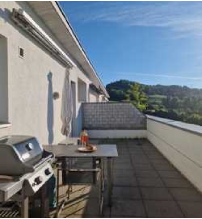
Die sonnenverwöhnte, rund 28 m 2 grosse Terrasse