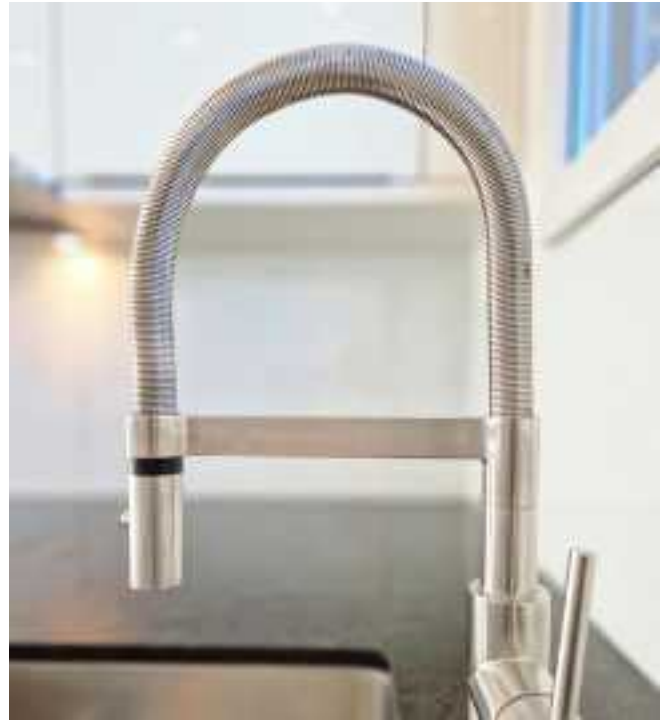
Der direkte Zugang zum Aussenbereich, eine formschöne Villeroy und Boch Armatur...