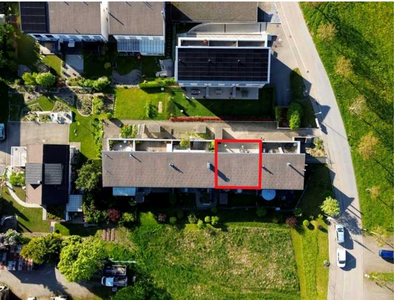
Luftaufnahme der Wohnanlage und der idyllischen Umgebung