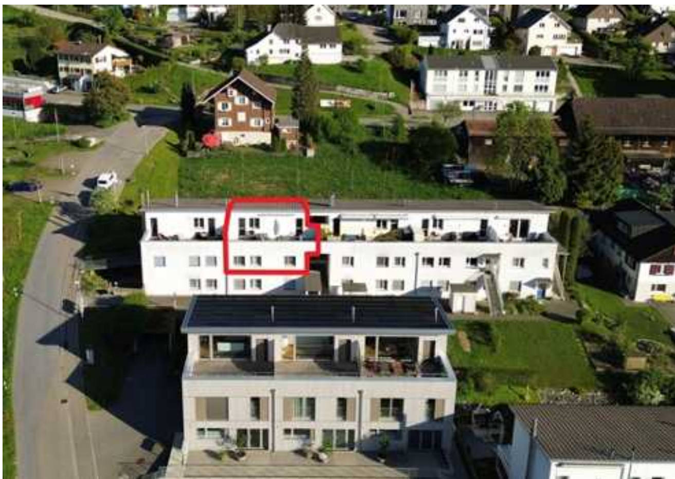
Die ruhige Wohnüberbauung mit der hervorgehobenen Wohnung aus nordwestlicher Perspektive