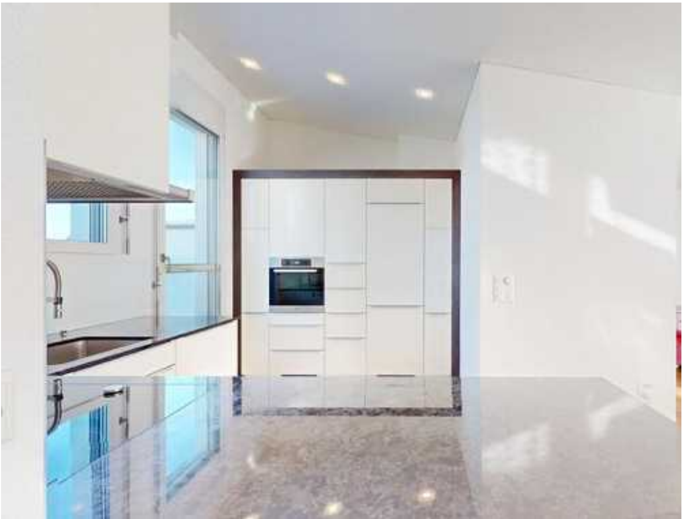
... sowie praktische Stauraumlösungen sorgen für Komfort und effektives Wirken