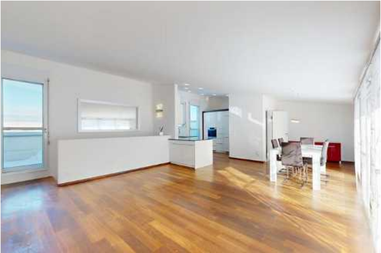
Der Wohn- und Essbereich mit Zugang zur Terrasse; die gezeigten Möbelstücke sind Teil des Kaufumfangs