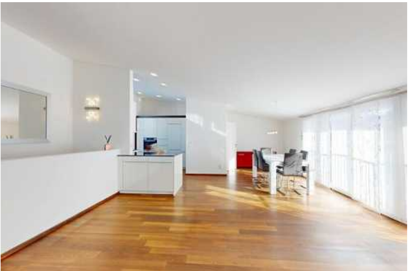
Der weitläufige Wohnraum bietet ein angenehmes Ambiente und viel Platz für individuelles Wohnen