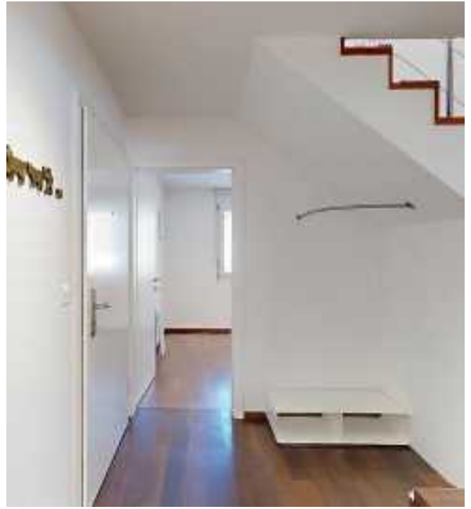
Stilvolle Details und praktische Stauraumlösungen sorgen hier...