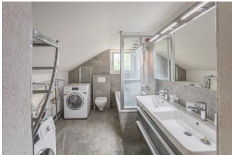
Badezimmer, 1. OG