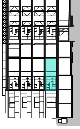
Coupe A-A 1/500