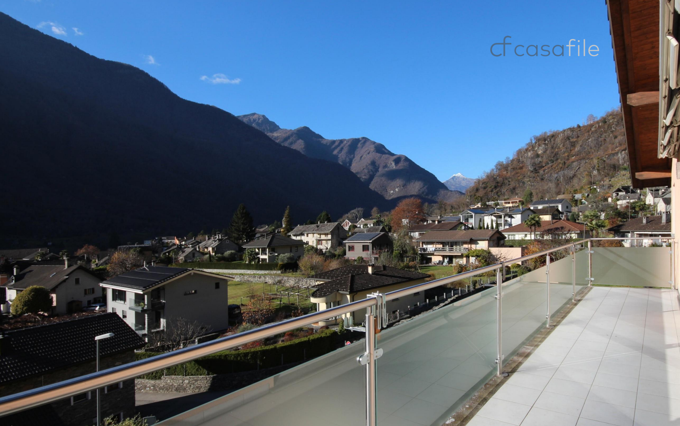
5.5-locali, appartamento attico con mansarda e splendida vista sulle montagne La Pisgiòla 1, 6673 Maggia