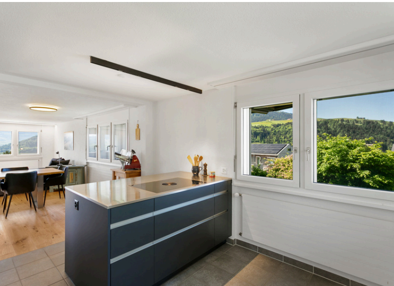
Grosse Küche mit Kochinsel