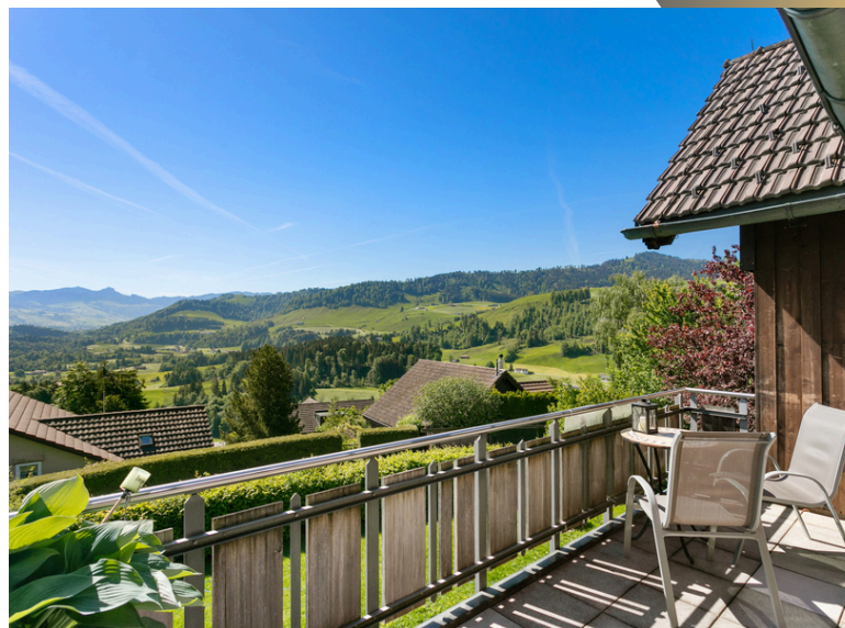
Traumhafte Aussicht auf das Appenzellerland